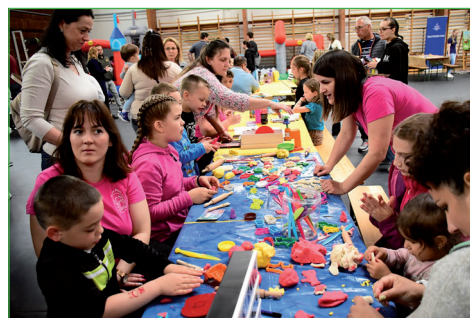
Domaszék legfiatalabb lakóit köszöntötte az önkormányzat a Családi Pikniken