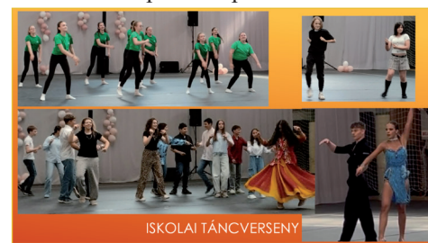
Az I. Iskolai Táncverseny 100 nevezővel

ötlet és lelkesedés állt. Az értékelés során nemcsak a technikai megvalósítást vették figyelembe, hanem a kreativitást, az összhangot, a színpadi jelenlétet és a csapatmunkát is. A rendezvény hangulata végig rendkívül jó volt. A versenyzőket szülők, testvérek, pedagógusok, osztálytársak és érdeklődők biztatták, így a program valódi közösségi élménnyé vált. Külön öröm volt látni, hogy a gyerekek mennyire felszabadultan és örömmel léptek színpadra. Bízunk benne,