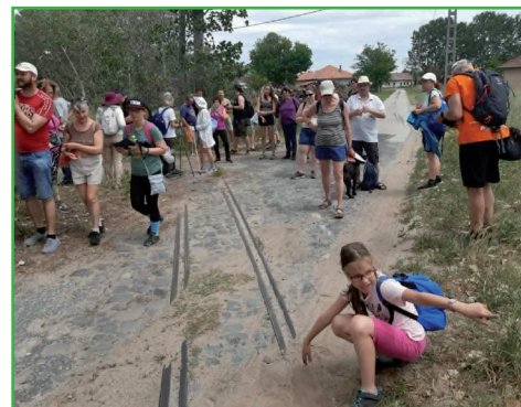
A túracsoport egy része a megmaradt síneknél