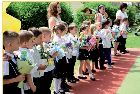
Az óvodai ballagás örömteli pillanatai