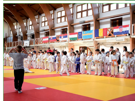
A sport közösségépítő ereje és a kitartás már két évtizede töretlen a helyi judosok körében