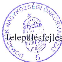
Ábrahám Zsolt Településfejlesztési és -üzemeltetési Bizottság elnöke