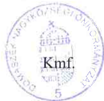
Sziráki Krisztián polgármester

Ez a rendelet 2024. január 1-jén lép hatályba.