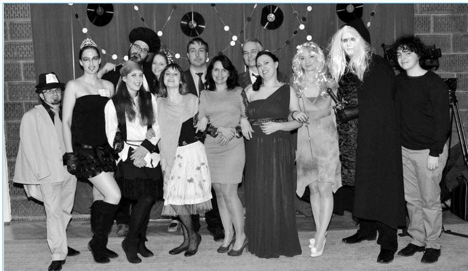
Beöltözve a maszkabálon

Domaszéki Élhetőbb Faluért Közhasznú Egyesület