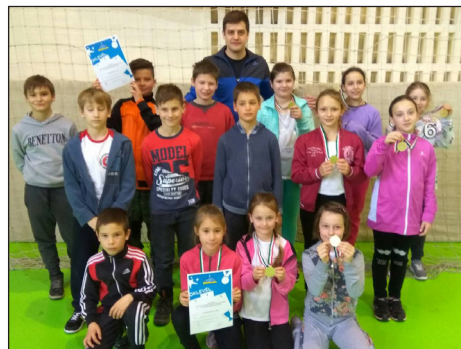
A grundbirkózó csapat

Február 13-án 16.30-tól: Iskolába csalogató programsorozat 1. alkalom. Várjuk szeretettel az érdeklődő nagycsoportos óvodásokat szüleikkel együtt!